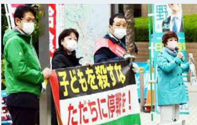
「ガザ侵攻はただちに停戦を」とよびかける日本共産党市議団=狛江駅

世界の人々に連帯して、「即時停戦」「子どもを殺すな」の声を広げに広げていきましょう。