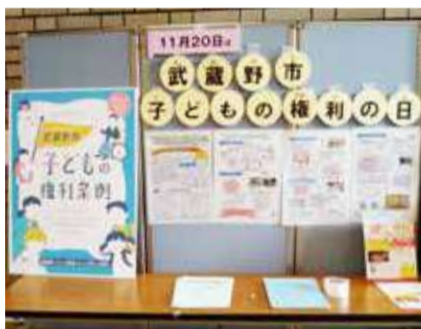
市役所入り口に展示されていました

月1日～11月30日までを「子ども・子育て応援フェスタ」を設定、ミュージカル、子育て講演会などのイベントを開催。子どもたち