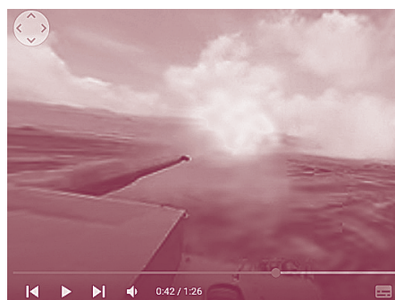
自衛隊のホームページで紹介されている戦車のVR乗車体験動画

た市主催の防災フェアで、自衛隊がGoogleを使ったVRで、子ども達や市民が戦車の射撃を体験をするということを行いました。