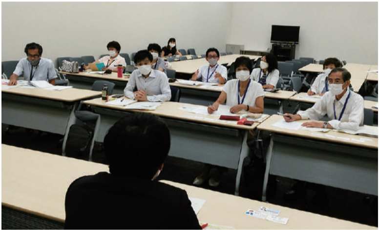
国交省に浸水被害対策を要望(8月18日、参議院議員会館)

国交省側は河道の掘削について「秋口から本復旧と河道の掘削を同時並行で行い令和6年度までに完了させたい。完了すれば石原観測所で60cm水位を低下させることができる」「小河内ダムの事前放流については5月27日に国土交通省と東京都、神奈川県が協定を結び、上流域予測降雨量が450mm以上の場合、台風襲来の3日前から約550万m 3 の洪水調節を行う」など答えました。