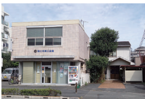
市はこの商工会館と駄倉地区センター(東和泉)を壊して中央図書館を移すと言うけれど...

日本共産党は9月議会で、基本方針にこだわらず市民と話し合い充実した中央図書館・公民館にすべきと訴えましたが市側は方針を変えようとはしませんでした。